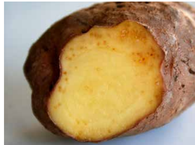
Figuur 4 : Schadebeeld bij aardappelen

Bovengronds zijn meestal geen symptomen zichtbaar. Ondergronds wordt het wortelknobbelaaltje herkend door de aanwezigheid van gallen. De omvang van de schade is afhankelijk van ras, temperatuur, aanvankelijke populatiedichtheid, en lengte van het groeiseizoen. Aanwezigheid in uitgangsmateriaal leidt tot afkeuring. Verkoop (export) binnen en buiten de EU is onmogelijk.