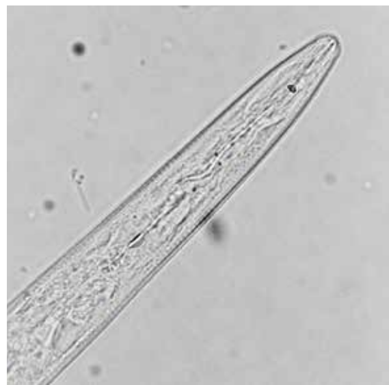
Figuur 2 : M. Chitwoodi

M. arenaria , M. Javanica en M. incognita